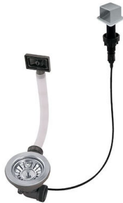
自动下水器 LIRA 8407 103